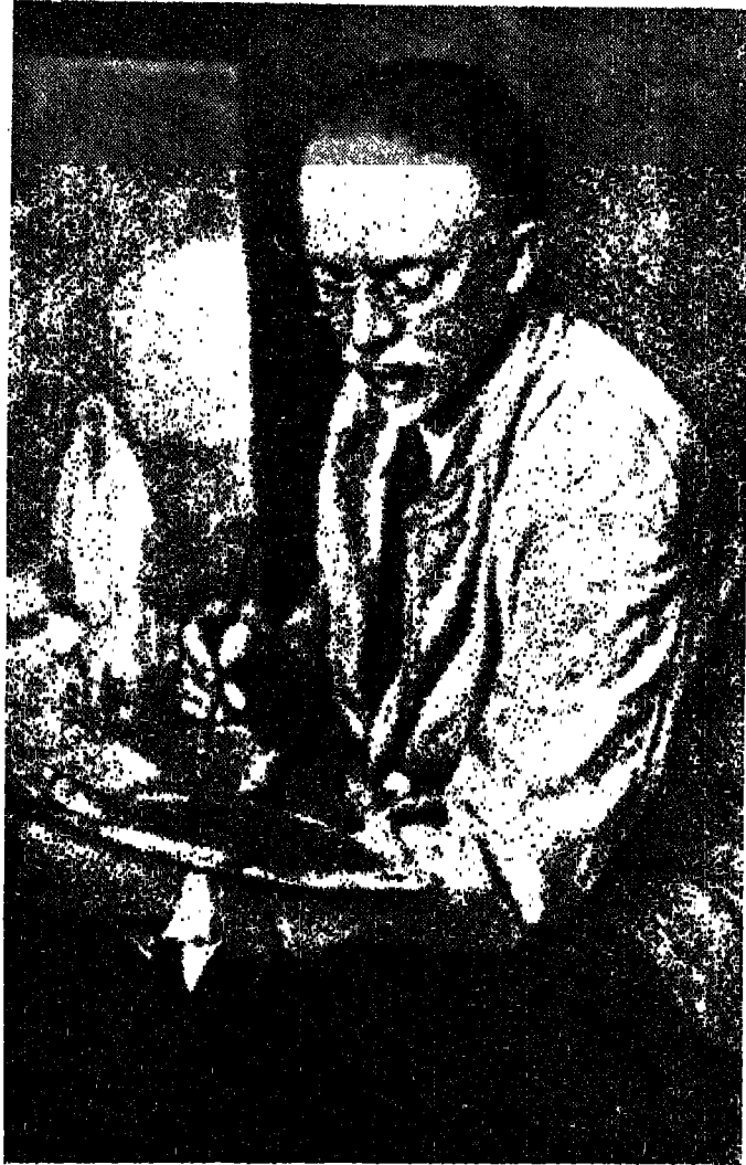
हैनरी ओसावा टैनर